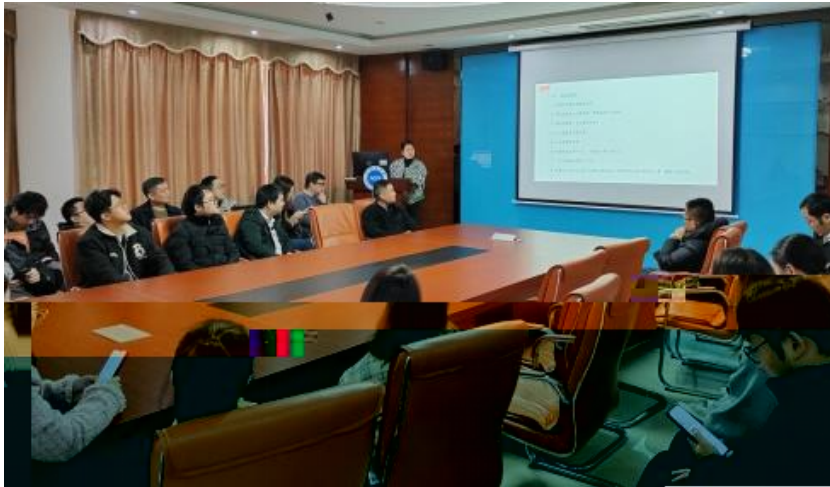
图 员工专业技能培训

，公 促 发 和 才 方 得 成 。 过 创 的 和 ， 不 动 公 的 持 成长， 工 供 的发 机会。 过 供多 化的 和发 ， “ 队 共 ” 等 活动 ( )， 帮 工 ( 技 和管 ； 并 的 和 规划， 工的 合 和 ， 包 导 发 计划、技 技 及 部 等， 地促 工的 方 发 。