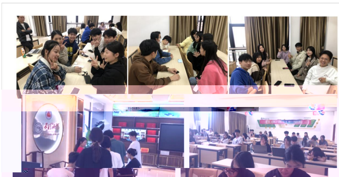
同学们实训项目选择过程