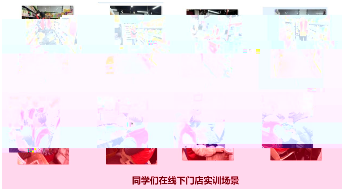
同学们在线下门店实训场景