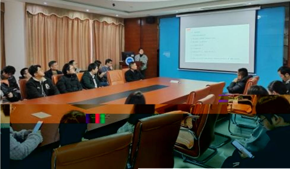
图 员工专业技 培