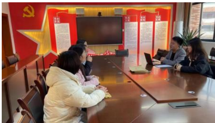
图 企开展学术 交 会